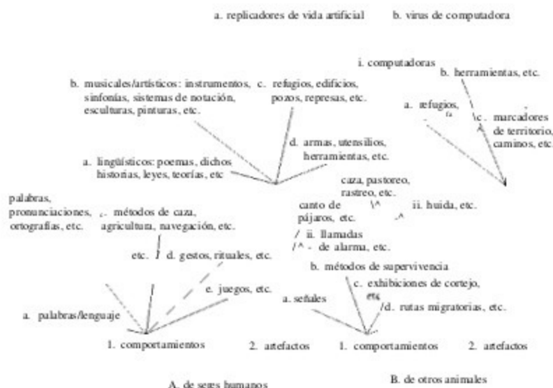
Taxonomía simple de los nuevos replicadores

los investigadores y asumir una «vida» por sí mismos en el rico y novedoso medio de Internet.